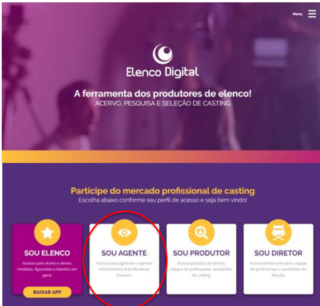
Tela de LOGIN ou NOVO CADASTRO de usuários Agentes, Agências e Bookers

Acesse opção SOU AGENTE em nosso site ou diretamente aqui: elencodigital.com.br/agencia